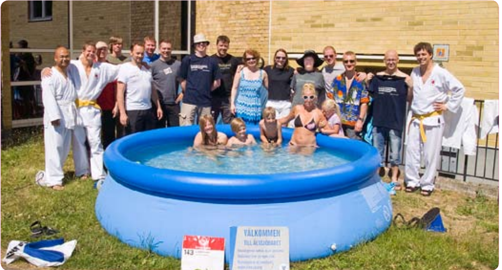
Hela sommarlägergänget samlat vid det mobila Älvsjöbadet.