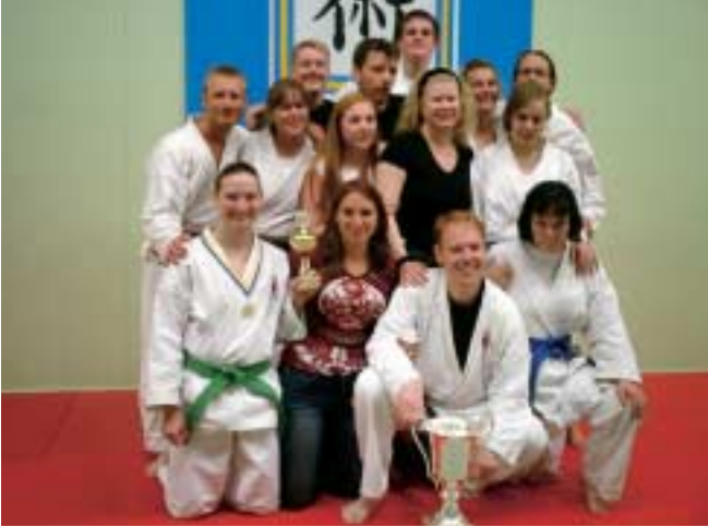
Med 15 deltagare, eller 22% av klubbens vuxna, blev vi aktivaste klubb för andra året i rad.

Älvsjö har etablerat sig som en av landets stora lägerklubbar när vi för andra året i rad fick pokalen för aktivaste klubb på sommarlägret. Förutom denna och förra årets pokal så har vi varit nära att ta hem pokalen vid fler tillfällen men missat med några få procent. Pokalen är ett vandringspris men blir vi aktivaste klubb även nästa år får vi behålla den och då kommer den att bli en permanent syn i dojo.