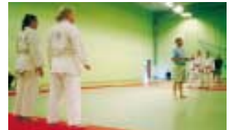
Helén och Li var modiga och ställde upp på sin allra första partävling under sommarlägret. Grattis till silvret och med förhoppningar om ännu fler medaljer!