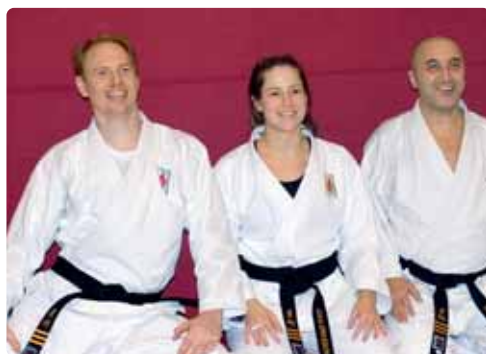
Stampe tillsammans andra glada nyblivna 3:e danare

På sista sidan kan du se bilder på alla som graderat under höstterminen 2006.