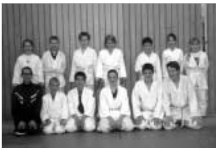
Glada barn på MONster-läger

I år har våra första knattar blivit stora nog att gradera till mon-grader. Kul att se att så många vill fortsätta träna så länge.