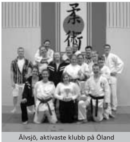
Älvsjö, aktivaste klubb på Öland

Diagrammen till vänster visar vilka grader som har uppnåtts under året. Diagrammen visar även föregående års siffror.