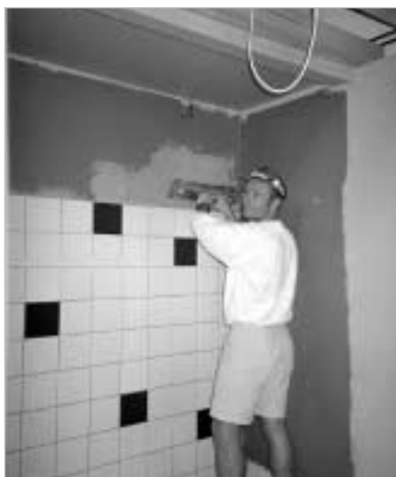
Dojon utrustas med duschar

Den årliga Julknytisen hölls i Dojon och avlöpte lugnt och städat. Vi längtade nog alla efter en behövlig semester efter graderingar och dyl. Med gemensamma krafter dukades långbordet upp för 15 personer, med levande ljus, mat och dryck i överflöd. Stämningen var god vilket gjorde kvällen till en lyckad avslutning på året.