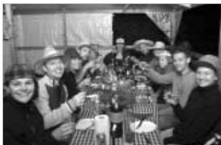
Kräftskiva, numera en liten tradition

I sedvanlig ordning anordnades en sommaravslutningsfest med lekar för både barn och vuxna. Vi började redan på eftermiddagen med stafettlekar för barnen i gröngräset på Älvsjöbadet. Sedan följde korvgrillning och saft samt lite diplomutdelning. I takt med att det blev senare så blev det fler och fler vuxna inslag i brännbollslaget. När barnen gått hem så vankades det lite starkare korvar med diverse såser runt grillen. När mörkret föll så fortsatte vi festen inomhus med "äta-kexcholkad-med-bestick-och-vantar-leken", dans och diverse drycker till sena natten.